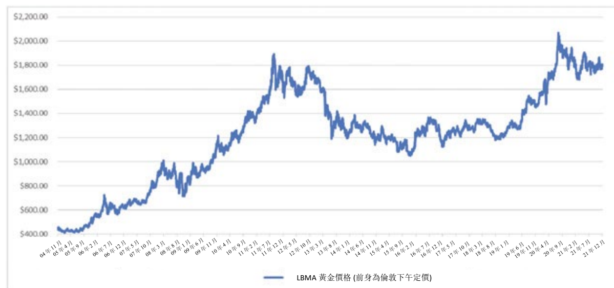
每日金價 – 2004年11月18日至2021年12月31日 LBMA 下午黃金價格（美元）

下圖提供黃金價格的歷史背景。該圖闡明由2004年11月18日至2021年12月31日期間每盎司美元黃金價格的變動，並自2015年3月20日起以LBMA下午黃金價格為基準，此前則以倫敦下午定價為基準。