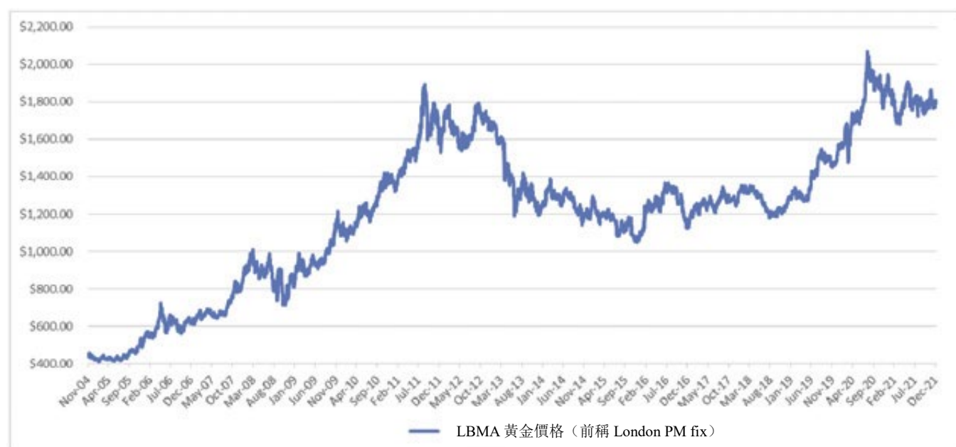
每日黃金價格 — 2004 年 11 月 18 日至 2021 年 12 月 31 日

由於黃金價格的變動預期會直接影響股份價格，投資者應瞭解近期黃金價格的變動。然而，投資者亦需知道黃金價格的過去變動並非未來變動的指標。下圖提供黃金價格的歷史背景。圖表闡明由2004年11月18日股份開始在紐約交易所買賣之日至2021年12月31日期間每盎司美元黃金價格的變動，並自2015年3月20日開始提供的LBMA下午黃金價格為基準，而先前則以倫敦下午定價為基準。